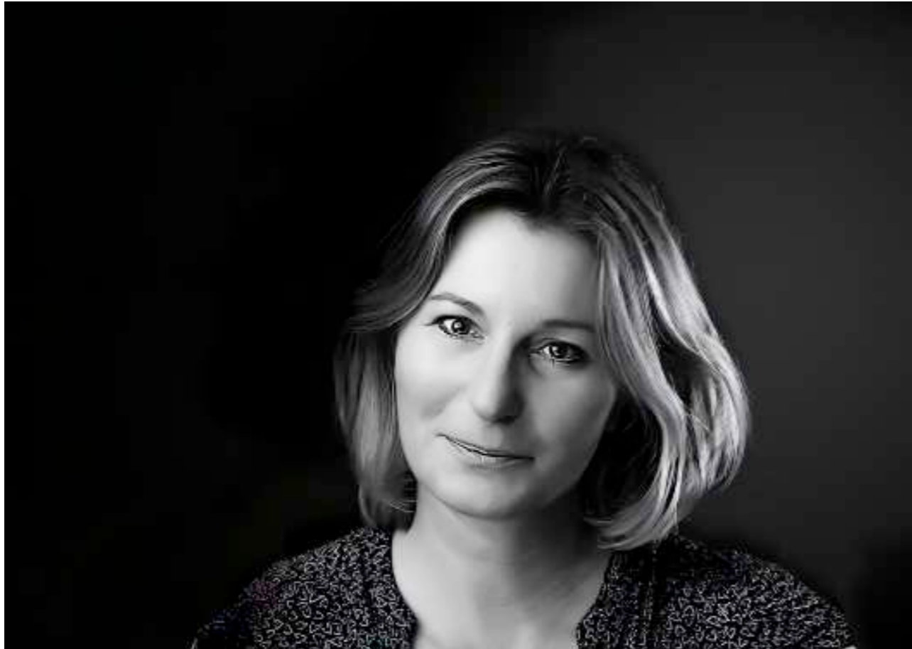
Sandrine Valentini Les Chérubins, Photographie d'Art

Alors que j'étais enceinte de mon enfant, je n'ai jamais réussi à trouver un photographe qui puisse traduire de façon précise mes envies et ma façon de concevoir l'enfance en image.